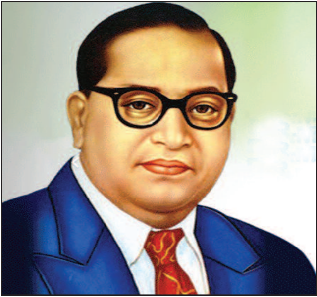
ਸ੍ਰੀ ਗੁਰੂ ਰਵਿਦਾਸ ਸਭਾ ਪਿਟਸਬਰਗ (ਕੈਲੇਫੋਰਨੀਆ) ਵੱਲੋਂ ਡਾ. ਅੰਬੇਡਕਰ ਜੀ ਦਾ ਜਨਮ ਦਿਨ 16 ਮਈ 2021 ਨੂੰ ਮਨਾਇਆ ਜਾ ਰਿਹਾ ਹੈ। (ਹੋਰ ਜਾਣਕਾਰੀ ਲਈ ਦੇਖੋ ਸਫ਼ਾ 2)