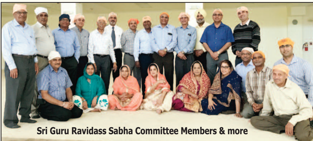
Sri Guru Ravidass Sabha Committee Members & more