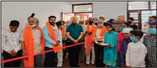
ਡਾ. ਅੰਬੇਡਕਰ ਦੇ ਜਨਮ ਦਿਨ ਮੌਕੇ ਸ੍ਰੀ ਗੁਰੂ ਰਵਿਦਾਸ ਟੈਂਪਲ ਬੋਲੀਨਾ ਵਿਖੇ ਕੰਪਿਊਟਰ ਸੈਂਟਰ ਅਤੇ ਲਾਇਬ੍ਰੇਰੀ ਦਾ ਉਦਘਾਟਨ। (ਰਿਪੋਰਟ ਅਤੇ ਤਸਵੀਰਾਂ ਦੇਖੋ ਸਫ਼ਾ 24 'ਤੇ)